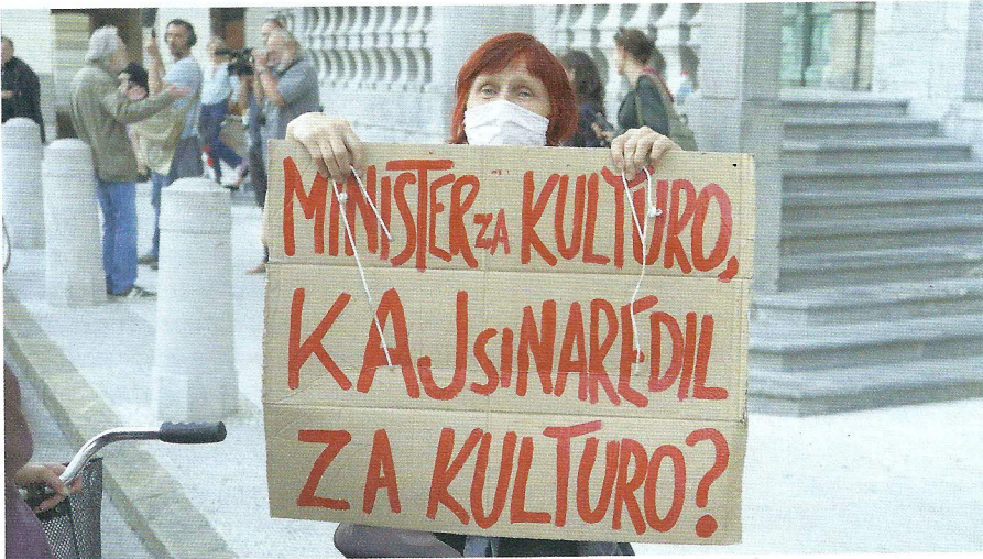
» Javnost je kritična do prevelike pasivnosti kulturnega ministra Vaska Simonitija med koronakrizo.